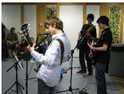
Begegnungsabend in der Cafeteria