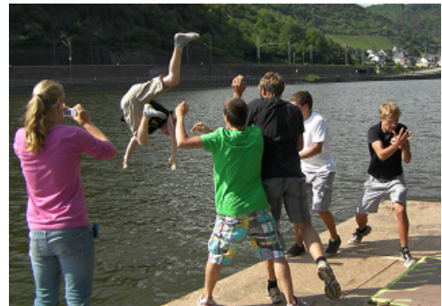
Der Steuermann „geht baden“